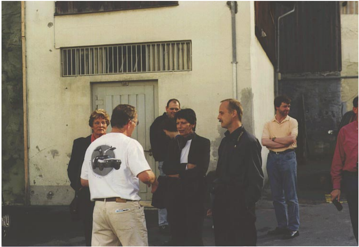
Alle sind gespannt vor dem grossen TV-Auftritt