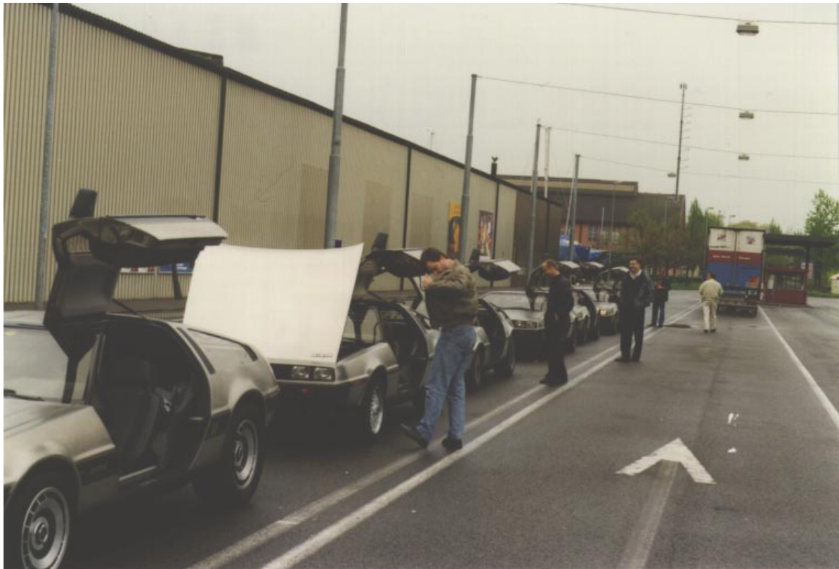
Warten auf die Fähre über den Bodensee