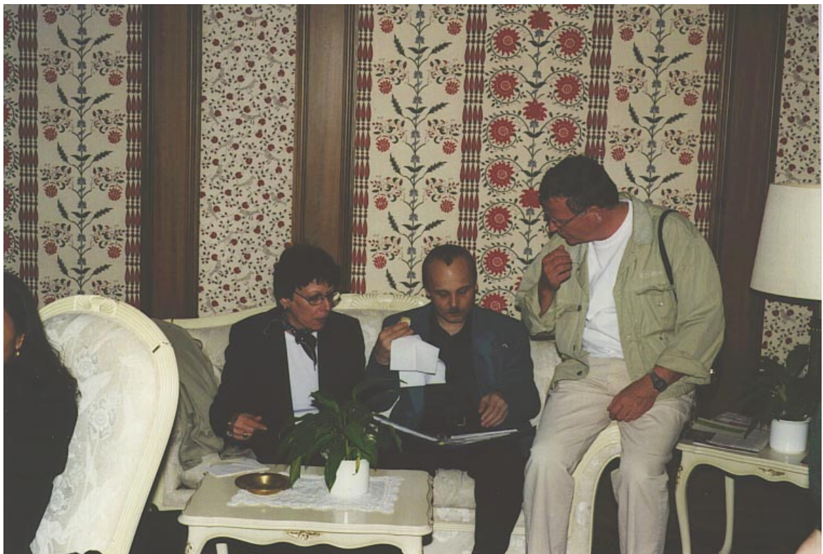
Fotosession beim Apéro