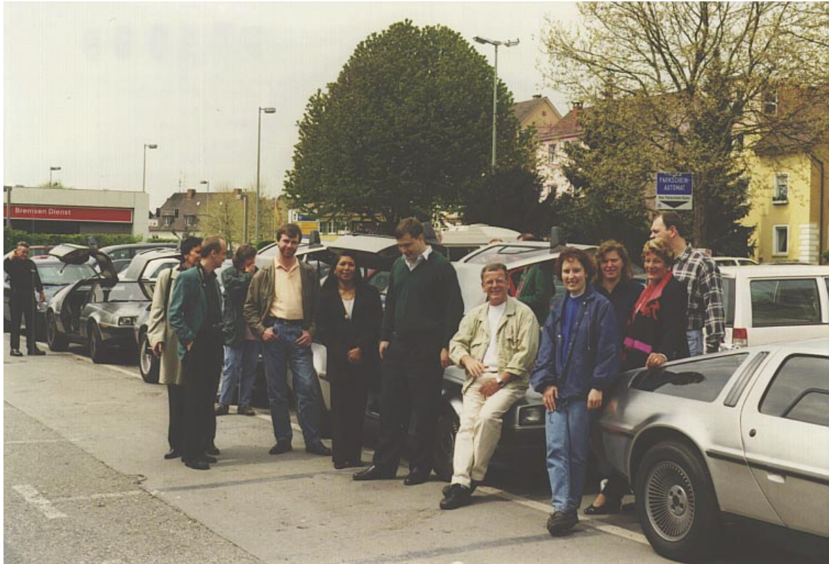
Gemütliches Plaudern nach dem Besuch des Zeppelin-Museums